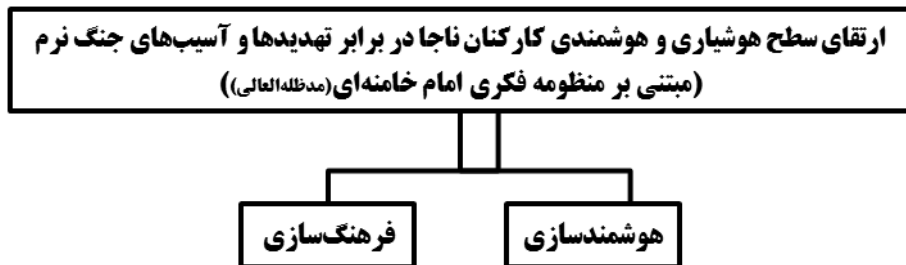
شکل ۲- الگوی مفهومی تحقیق

تفسیر مضامین سازمان دهنده به مضمون فراگیر ناظر بر داده‌های جدول بالا نشان می‌دهد؛ یکی از راه‌کارهای ارتقای سطح هوشیاری و هوشمندی کارکنان ناجا در برابر تهدیدها و آسیب‌های جنگ نرم مبتنی بر منظومه فکری امام خامنه‌ای (مدظله‌العالی) موضوع مهم «فرهنگ‌سازی» است. مضمون فراگیر فرهنگ‌سازی دارای (۱۸) مضمون سازمان‌دهنده بوده است. فرهنگ، مجموعه پیچیده‌ای از دانش‌ها، باورها، هنرها، قوانین، اخلاقیات، عادات و هرچه که فرد به‌عنوان عضوی از جامعه از جامعه خویش فرامی‌گیرد. در رویکرد اسلامی، فرهنگ‌سازی به معنای شکل‌دهی به باورها، هنجارها و مبانی فکری افراد جامعه مبتنی بر تعالیم و آموزه‌های دینی است. در این تحقیق نیز فرهنگ‌سازی در نیروی انتظامی ناظر بر جهت‌دهی و نهادینه‌سازی هنجارها، قوانین و مقررات، ارزش‌ها، مبانی و رویکردهای دین مبین اسلام در بین کارکنان ناجاست. فرهنگ‌سازی به این معناست که آیتم‌ها و المان‌های فرهنگی که در سازمان نسبت به آنها توجه کمتری شده است را برای افراد دوباره یادآوری کنیم؛ چراکه فرهنگ، مفهومی است که از طریق اجتماعی شدن به افراد آموزش و انتقال داده می‌شود، این مفهوم در حوزه جنگ نرم بسیار کاربردی و راه‌گشاست.