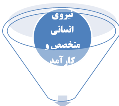
اشراف اطلاعاتی در بحران‌های امنیتی برای مقابله با تهدیدها

همان‌طور که در جدول بالا مشاهده می‌شود وقتی همه متغیرها در معادله رگرسیون به‌طور هم‌زمان وارد شدند تنها متغیر «استفاده از نیروی انسانی متخصص و کارآمد» معنادار شده است؛ یعنی عدد معناداری آزمون این متغیر کوچک‌تر از ۰/۰۵ است؛ بنابراین تنها این متغیر تأثیر معناداری بر اشراف اطلاعاتی در شرایط بحران‌های امنیتی برای مقابله با تهدیدها را داشته و فرض تساوی این ضریب با صفر رد می‌شود و بقیه متغیرها تأثیرهای معناداری در اشراف اطلاعاتی ندارند و باید آنها را از معادله رگرسیون خارج کرد. سرانجام معادله استاندارد رگرسیون به شکل ذیل ترسیم می‌گردد: